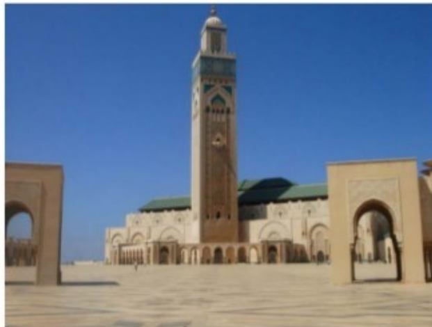
Figura 1 – Moschea di Hassan II, Casablanca

Arrivo all'aeroporto internazionale di Mohamed V a Casablanca, benvenuto e assistenza da parte del nostro personale, oppure assistenza presso l'hotel in cui soggiornate a Casablanca e partenza per la visita della grandiosa moschea di Hassan II, la più grande del Marocco e la terza moschea più grande del mondo, con il suo minareto di 210 metri.. Poi proseguimento per Rabat. Cena libera e pernottamento in riad.