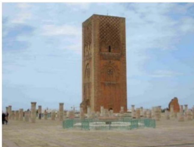
Figura 2 Rabat, Mausoleo